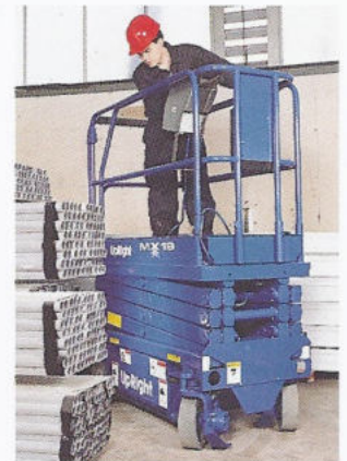
Der extrem kleine Drehradius und kompakte Abmessungen für hervorragende Manövrierbarkeit

Wir behalten uns das Recht auf Änderung der technischen Daten ohne Benachrichtigung vor. Die in dieser Broschüre abgebildeten Photos und Schaubilder dienen nur Werbezwecken. Falls Sie detaillierte Informationen über die ordnungsgemäße Verwendung und Wartung dieser Ausrüstung wünschen, bitten wir Sie, das Anwenderhandbuch, von UpRight zu konsultieren. UpRight stellt ebenso eine ganze Reihe von Gerüsten und weiteren Arbeitsplattformen her. Wenden Sie sich für weitergehende Informationen bitte an Ihre UpRight Vertretung vor Ort.