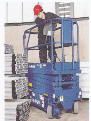
Der extrem kleine Drehradius und kompakte Abmessungen für hervorragende Manövrierbarkeit

Wir behalten uns das Recht auf Änderung der technischen Daten ohne Benachrichtigung vor. Die in dieser Broschüre abgebildeten Photos und Schaubilder dienen nur Werbezwecken. Falls Sie detaillierte Informationen über die ordnungsgemäße Verwendung und Wartung dieser Ausrüstung wünschen, bitten wir Sie, das Anwenderhandbuch, von UpRight zu konsultieren. UpRight stellt ebenso eine ganze Reihe von Gerüsten und weiteren Arbeitsplattformen her. Wenden Sie sich für weitergehende Informationen bitte an Ihre UpRight Vertretung vor Ort.